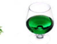
Chartreuse des Pères Chartreux**