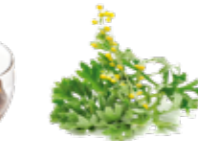
Génépi des Pères Chartreux**