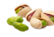
Pistache et ses morceaux