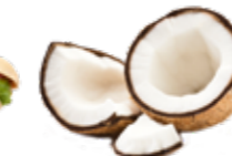
Noix de coco