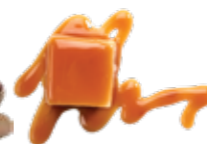
Caramel beurre salé