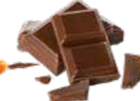
Chocolat et ses morceaux