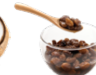
Rhum* raisins macérés