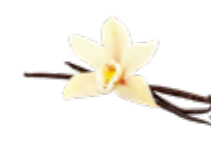
Vanille intense de Madagascar