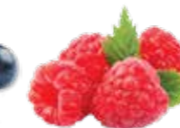
Douceur de framboise