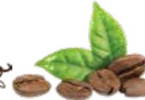
Café pur Arabica